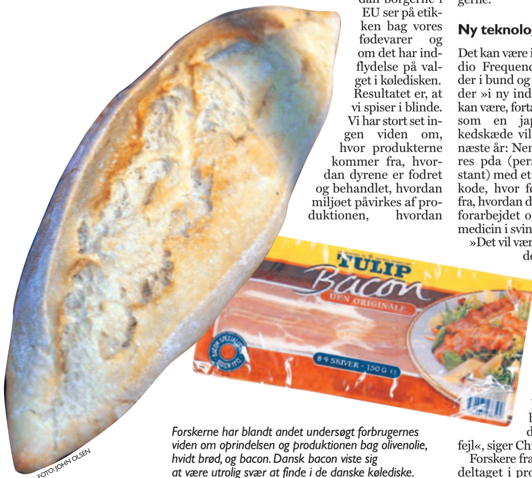
Forskerne har blandt andet undersøgt forbrugernes viden om oprindelsen og produktionen bag olivenolie, hvidt brød, og bacon. Dansk bacon viste sig at være utrolig svært at finde i de danske kølediske.

ført til tre spændende historier om olivenolie (græsk studie), hvidt brød (engelsk) og bacon (dansk).